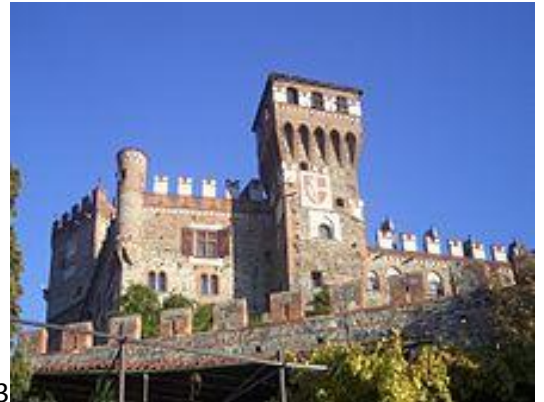
1 Palazzo di Westminster (o del parlamento) (Londra) 2 Cattedrale di San Patrizio (New York) 3 Castello di Pavone Canavese Artisti: E. Viollet-le-Duc (Francia), A. d'Andrade (Italia)