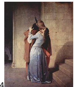
1 Artisti: W. Blake, W. Turner(3), J. Constable (Regno Unito), C. D. Friedrich(2) (Germania), E. Delacroix(1), J.-L. T. Géricault, (Francia), F. Hayez(4) (Italia)