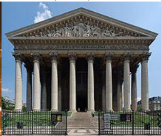
Arco di trionfo (Parigi) Chiesa de la Madeleine (Parigi)