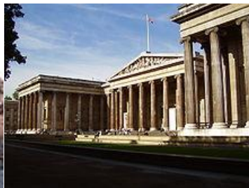
Chiesa della Gran Madre di Dio (Torino) British Museum (Londra)