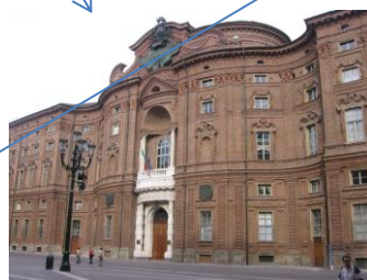
G. Guarini, la curva facciata di Palazzo Carignano, Torino