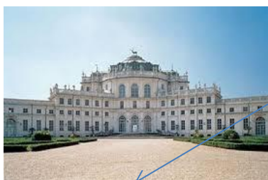
F. Juvarra, la stravagante Palazzina di caccia di Stupinigi (... sul tetto c'è la statua di un cervo!), Nichelino (Torino)

Evoluzione del Barocco, il termine deriva dal francese rocaille (conchiglia) elemento decorativo molto usato all'epoca. Nel R. predominano le forme sinuose, le curve le sinuosità, le decorazioni fittamente intrecciate, i tralci di vite, i concavi e i convessi.