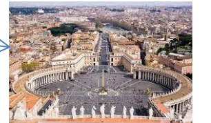
G.L. Bernini, l'ellittica piazza San Pietro e il relativo colonnato, Città del Vaticano