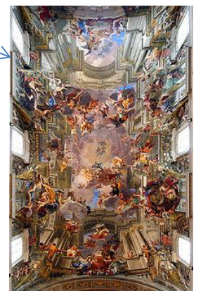
A. Pozzo, soffitto della Chiesa di Sant'Ignazio, Roma