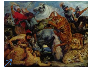
P.P. Rubens, Caccia alla tigre e al leone, (Museo delle Belle Arti), Rennes (Francia)