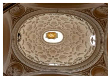
F. Borromini, cupola ellittica della chiesa di S. Carlo alle Quattro Fontane, Roma