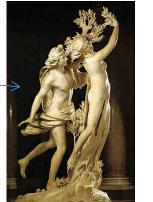
G.L. Bernini, Apollo e Dafne, (Galleria Borghese), Roma