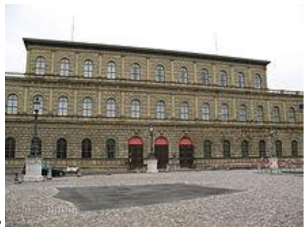
2 Königsbau, (Monaco di Baviera, Germania)